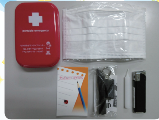
今年のボラセンPRグッズ「ポータブルエマージェンシー」

今後も色々な方になかはらボランティアセンターをもっと知っていただけるよう、アイデアを考えて参加したいと思います。