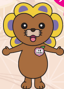
中原区社協 マスコットキャラクター 「中原パルるん」