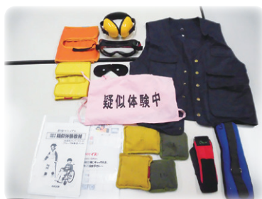
高齢者疑似体験セット