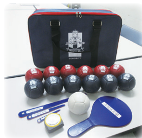
ボッチャボールセット