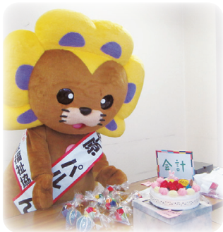
可愛い布おもちゃに思わず見とれてしまいました