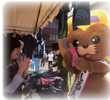
新商品を紹介してもらいました！