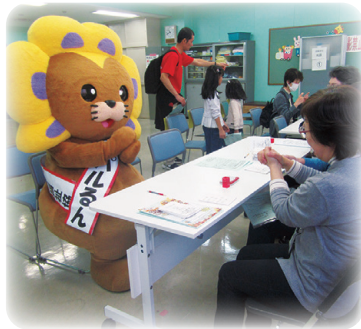
手話を教えてもらいました♪

来場された方々と一緒に色々なブースを見学、体験したパルるん。皆さんのたくさんの笑顔が見られ、楽しい1日を過ごすことができました。