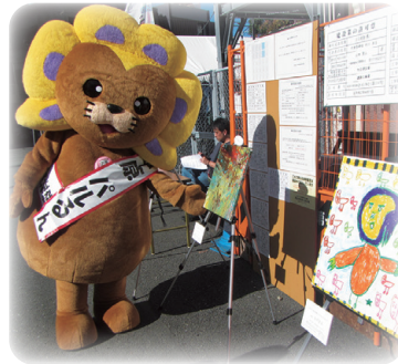
会場にはパラアートの展示も！