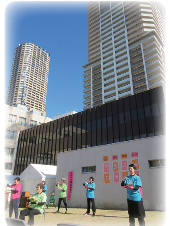
晴天のもと、芝生広場ステージでの発表もありました