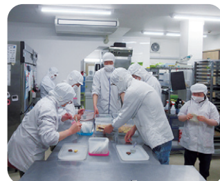
クッキーの袋詰め作業中です。

お店は元住吉駅や武蔵小杉駅からも歩いて行ける距離にあります。まずはここにお店があることを知ってもらいたいとお話されていました。明るい従業員さんたちとの交流や、たくさんのおいしいお菓子を楽しみに、ぜひ足を運んでみてはいかがでしょうか。