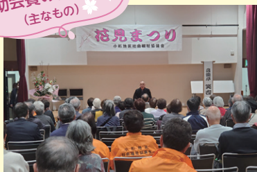
地区社協事業の財源として (交流会・花見まつりなど)