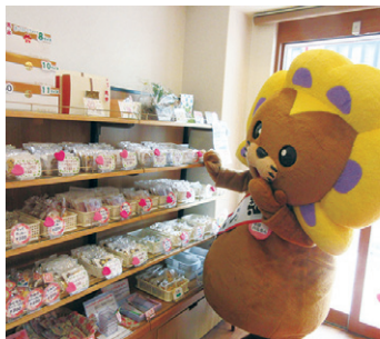
どれにしようか迷います…