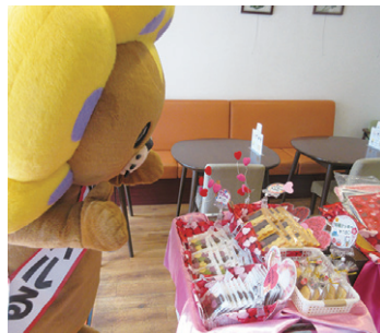
可愛いお菓子がたくさん！