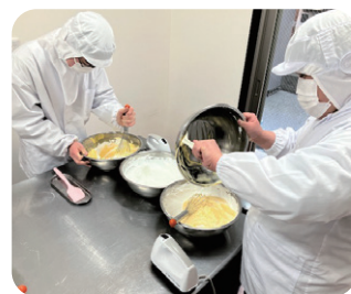
パウンドケーキやシフォンケーキの製造中です。

製造作業をしている皆さんは真剣に、正確に、とても丁寧な作業をされており、心のこもった商品ができていく過程を見ることができました。