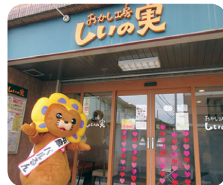
可愛い看板が目印！

働いている皆さんにおすすめの商品を伺うと、シフォンケーキやパウンドケーキ、クッキーなど様々な商品を紹介していただきました。その他にも麩ラスクや動物型のかわいいお菓子などがたくさん。味の種類も様々です。