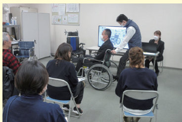
ボランティア活動の推進 (ボランティア養成講座など)