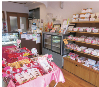
美味しそうなお菓子が並ぶ店内