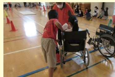
福祉教育事業のために (福祉授業・機材貸出など)